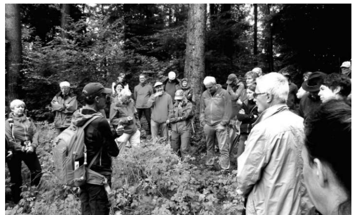
Fischzucht, Kiesabbau, Windkraft (geplant), Klimawandel. Der Altdorfer Wald war und ist dem Wandel unterworfen.

Weitere Informationen zu unserem diesjährigen Altdorfer Wald Exkursionsprogramms finden Sie im BUND Terminkalender unter https://www.bund-ravensburg.de