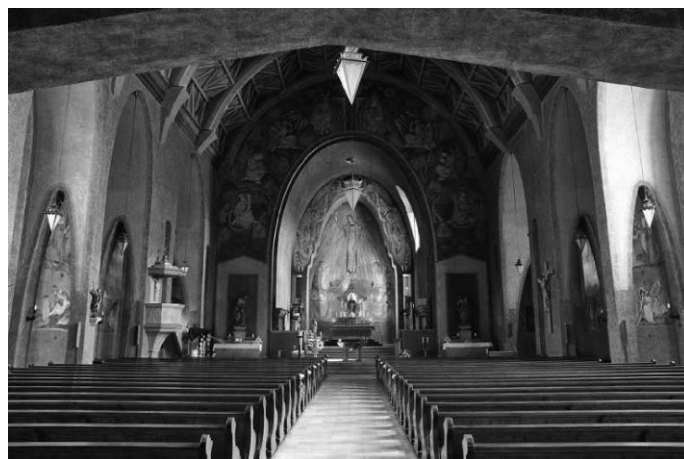
Blick in die „blaue Grotte/Kirche“ in Baienfurt