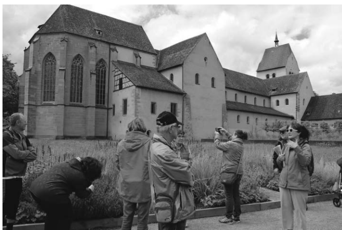
Münster St. Maria und Markus vom Klostergarten gesehen