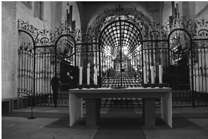
Münster St. Maria und Markus - Innenansicht

Nach dem Niedergang der Abtei setzt erst mit Abt Friedrich von Wartenberg (1427 - 1435) wieder ein geregeltes monastisches Leben ein. Nach der Inkorporation in das Bistum Konstanz im Jahr 1540 bestand das Kloster als Priorat weiter. Fürstbischof Jakob Fugger ließ von 1605 bis 1610 neue Konventsgebäude auf der Südseite des Münsters errichten. Nach der Fertigstellung der Anlage wurde das „Alte Kloster“ auf der Nordseite abgebrochen. Das Kloster wurde 1757 aufgelöst. Die Fuggerschen „neuen“ Konventsgebäude dienen heute als Pfarrhaus und Sitz der Gemeindeverwaltung. Im dazugehörigen weitläufigen Keller keltert der Winzerverein den Reichenauer Wein.