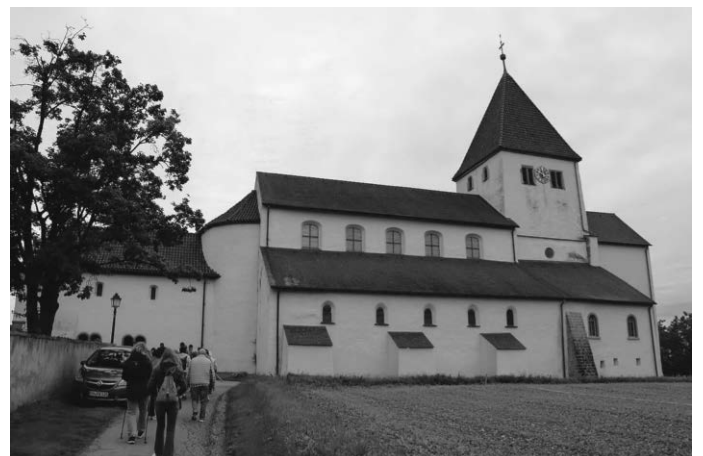
Kirche St. Georg

Acht großflächige, mehr als 4 m breite und über 2 m hohe Wandbilder im Mittelschiff zeigen Wundertaten Jesu und illustrieren die Macht Jesu über Naturgewalten, Krankheiten, Leben und Tod. Die Wandbilder entstanden Ende des 10. Jahrhunderts. Sie gehören damit zu den frühesten Zeugnissen ihrer Art nördlich der Alpen und stehen in engem Zusammenhang mit der im Reichenauer Skriptorium entstandenen Buchmalerei, die ebenfalls um 1000 ihren Höhepunkt erreichte.