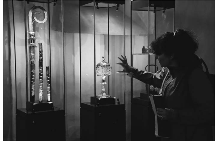
Reliquien in der Schatzkammer

hunderts. Sie birgt Kunstschatze und Kultgegenstände aus dem 5. - 18. Jahrhundert von hohem Rang. Die kostbarsten Kunstwerke sind die Reliquienschreine, die heute noch bei den Prozessionen über die Insel getragen werden. Der bedeutendste ist der Markusschrein aus dem Jahr 1305 mit Gebeinen des Evangelisten Markus.