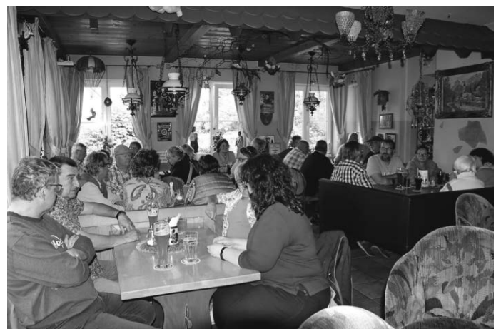
Vesper in der Landvorteil „zur Geli“ in Dürnast